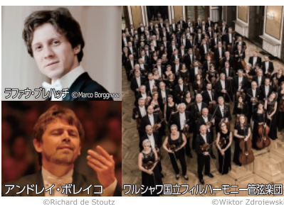
ラファウ・ブレハッチ アンドレイ・ボレイコ ワルシャワ国立フィルハーモニー管弦楽団

2005年ショパン・コンクール優勝後、確実にレパートリーを広げ続け、作品の深い本質に迫るブレハッチが2018年に続き、リサイタルとコンツェルト公演で全国ツアーを行う。コンツェルトのプログラムはショパン前半生のポーランド時代に書かれた最高傑作と言える第1番、第2番の2曲。共演はポーランドを代表する、ショパンの音楽を熟知するワルシャワ国立フィル。指揮は今シーズン音楽監督に就任するボレイコ。叙情あふれる名曲をブレハッチが紡ぎあげる一期一会のこの公演は聴き逃せない。